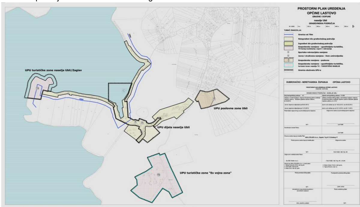
Slika 1. PPUO Lastovo - Građevinsko područje naselja Uble

Pravna osnova za izradu i donošenje Plana, utvrđena je člancima 79. i 85. Zakona o prostornom uređenju ('Narodne novine' broj 153/13) - u daljnjem tekstu: Zakon i člankom 125. Odredbi za provođenje Prostornog plana uređenja Općine Lastovo (Službeni glasnik Općine Lastovo broj 1/10). Izrađivač plana je ASK Atelier d.o.o. iz Zagreba.