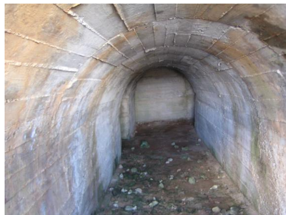
Slika 3. Tuneli

Do zone obuhvata dolazi nerazvrstana cesta iz naselja Uble, a koja predstavlja osnovnu prometnu i infrastrukturnu vezu područja u obuhvatu Plana s naseljem.