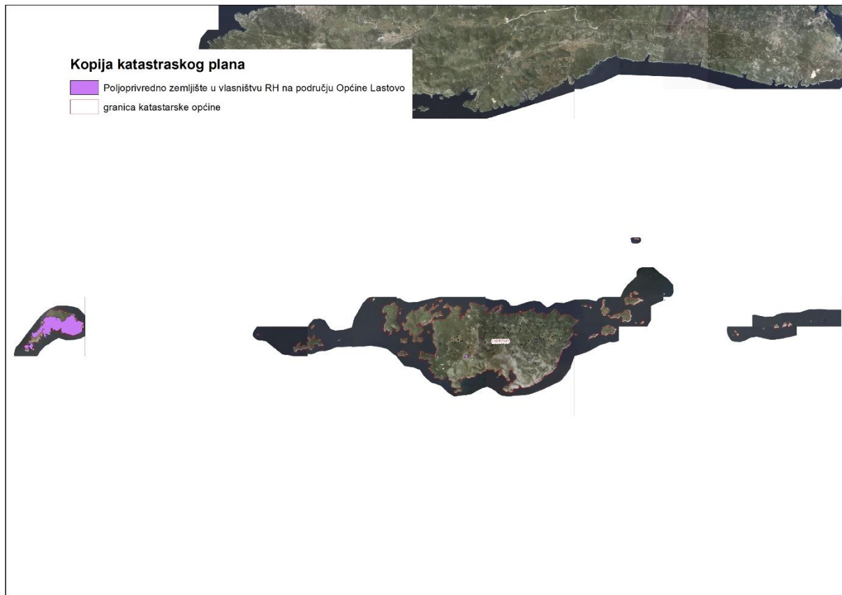
Slika 2: Državno poljoprivredno zemljište na području Općine Lastovo