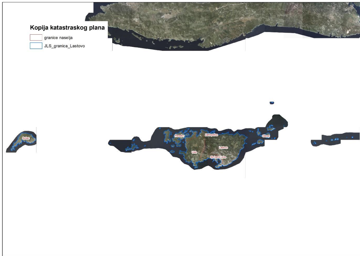
Slika 1: Naselja Općine Lastovo, Izvor: Državna geodetska uprava - obrada autora