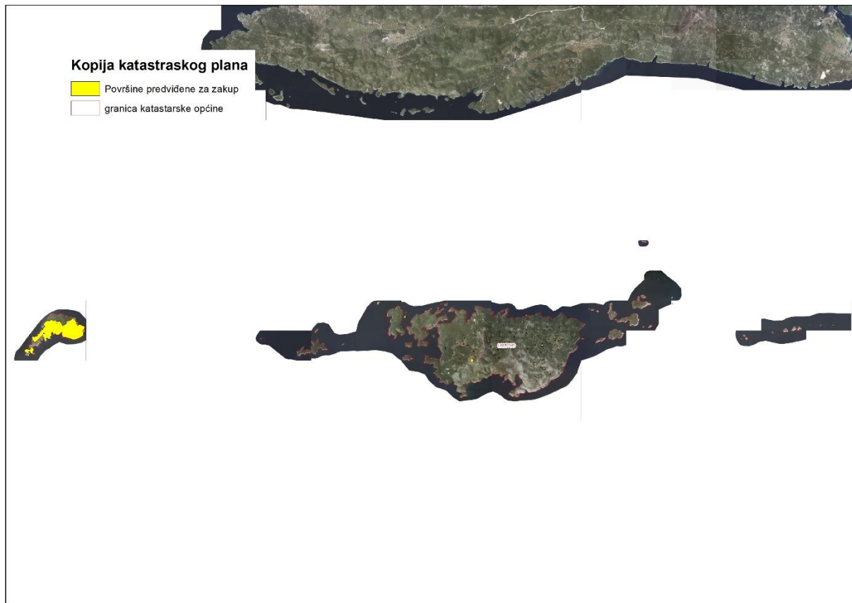
Slika 4: Površine određene za davanje u zakup

Kopija katastrarskog plana sa prikazom svih katastrarskih čestica poljoprivrednog zemljišta u vlasništvu RH koje su određene za davanje u zakup, sa podlogom digitalne ortofoto karte Općine Lastovo izrađena je prema službeno dostavljenim podacima Državne geodetske uprave, podataka Općine Lastovo i Ministarstva poljoprivrede za potrebe izrade Programa i nalazi se u PRILOGU KKP-3 dok je njen umanjeni prikaz vidljiv na slici 4.